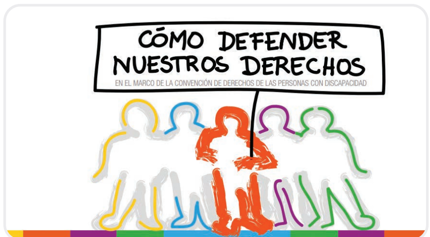
Fig. 5. Los movimientos asociativos son clave en el avance de los derechos de las personas con enfermedad mental.

Precisamente por ser una entidad autogestionada por personas con enfermedad mental y su voluntad empoderadora, es movimiento todavía pionero en nuestro país.