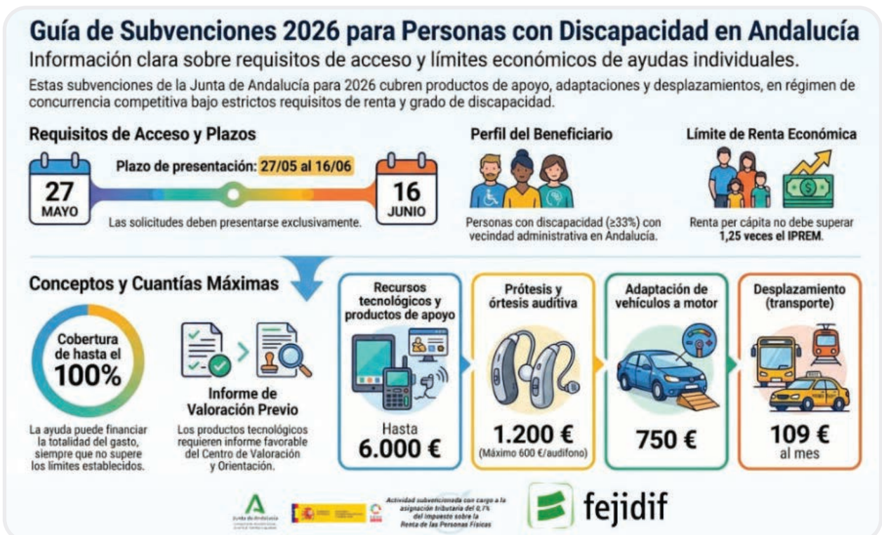
Fig. 4. Guía de Subvenciones 2026 para Personas con Discapacidad en Andalucía.

La Junta de Andalucía convoca anualmente subvenciones, en régimen de concurrencia competitiva, para personas en situación de vulnerabilidad, entre ellas las personas con discapacidad. La Orden de 20 de mayo de 2026 convocan estas subvenciones.