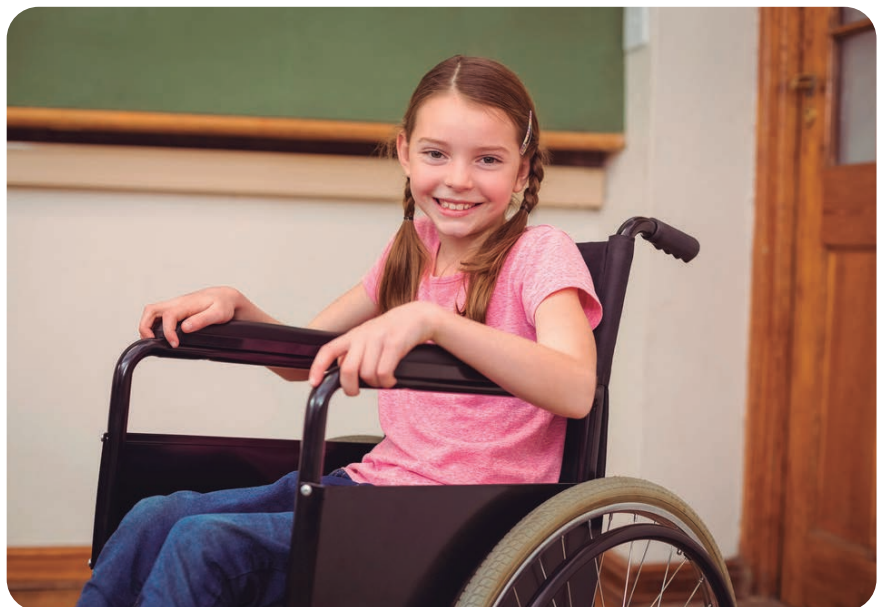
Fig. 3. La discapacidad física es el grupo de discapacidad con más personas en Andalucía.