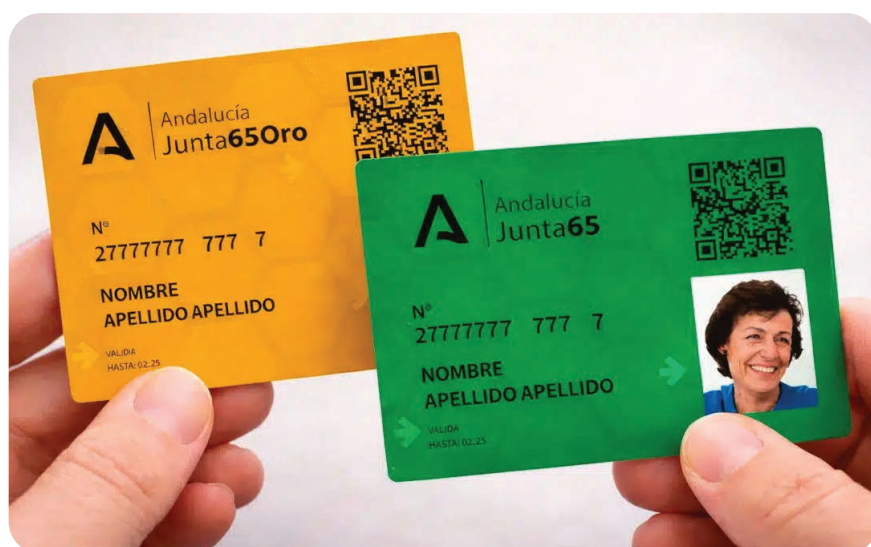
Fig.2. Tarjeta Andalucía Junta 65.

Las Entidades Locales, a través de los Servicios Sociales Comunitarios, son las encargadas de detectar las situaciones de exclusión social, efectuar su primera valoración y tramitar, en su caso, la declaración de situación de exclusión social, de conformidad con los requisitos establecidos en la Orden 11 de febrero de 2008.